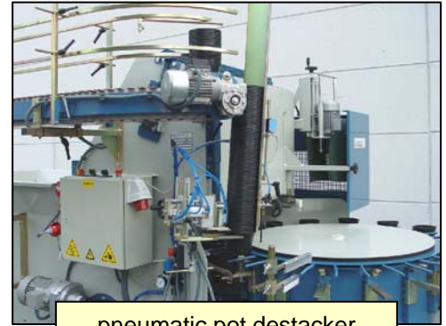
pneumatic pot destacker