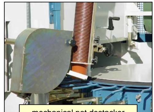
mechanical pot destacker