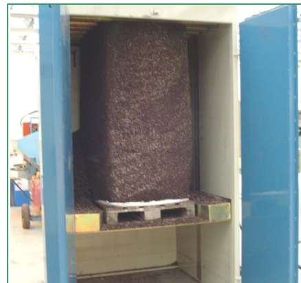
verticaal lift systeem système élévateur verticale