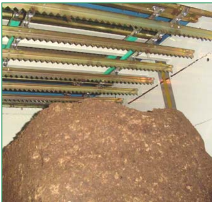
schraper bovenaan gratteur en haut