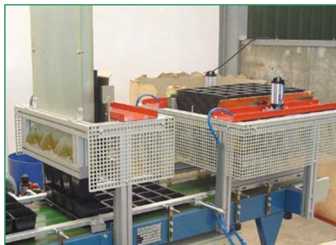
destacking of P9 pots Entstapeln von Topf P9