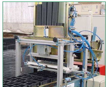
destacking of square pots into clayettes Entstapeln von Ecktopfe und Clayettes