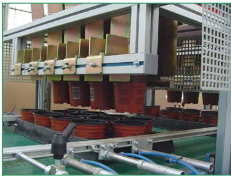
multiple pot destacker Multi Topf Entstapler