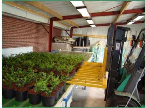
push-over system Drück Einheit