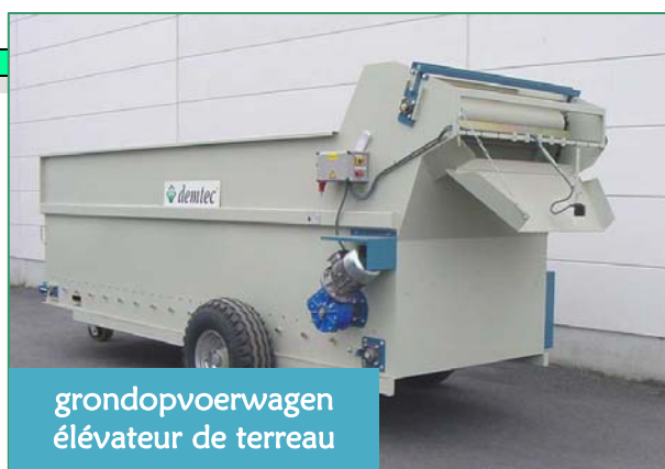
grondopvoerwagen élévateur de terreau