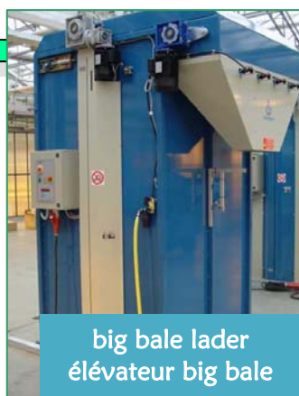
big bale lader élévateur big bale