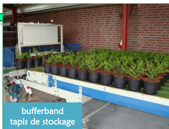
bufferband tapis de stockage