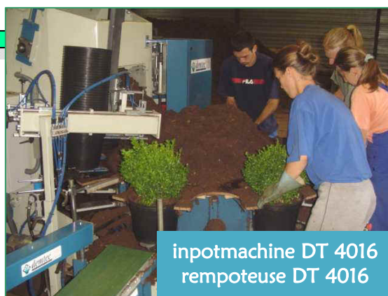
inpotmachine DT 4016 rempoteuse DT 4016