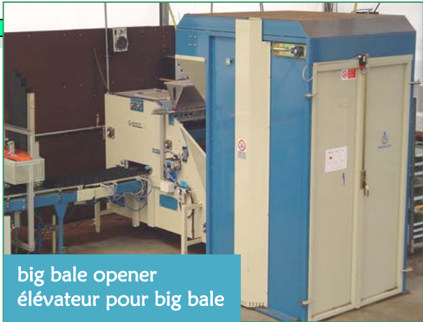
big bale opener élévateur pour big bale