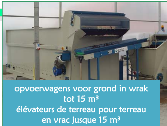
opvoerwagens voor grond in wrak tot 15 m 3 élévateurs de terreau pour terreau en vrac jusque 15 m 3