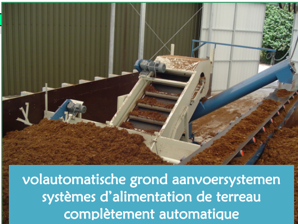
volautomatische grond aanvoersystemen systèmes d'alimentation de terreau complètement automatique