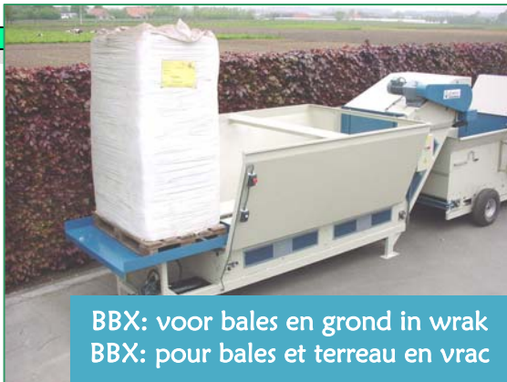
BBX: voor bales en grond in wrak BBX: pour bales et terreau en vrac